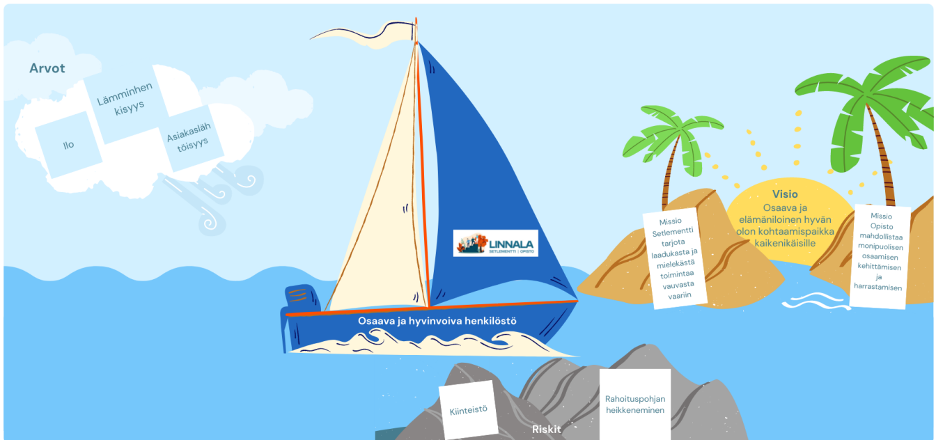
Linnalan strategia kuvana